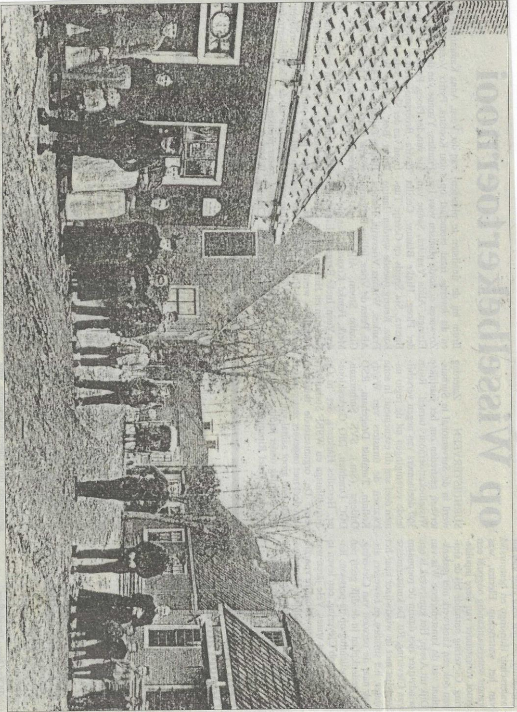
De Geawei te Augustinusga rond 1905 met een aantal bewoners. De postbode (met pet en halsketting) stond ongeveer in het midden. Rechts: de timmerwinkel (gebouw staat er nog).